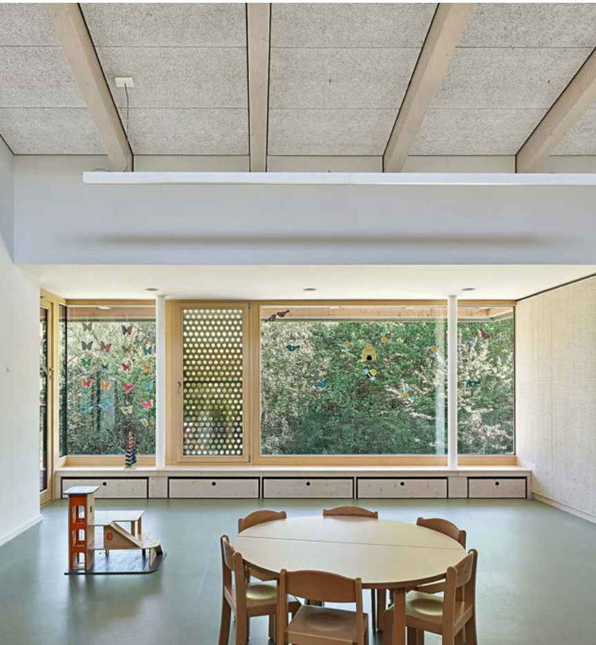
Allseitig wirkt der grüne Außenraum in die Innenräume. • The green outdoor space influences the interior spaces.