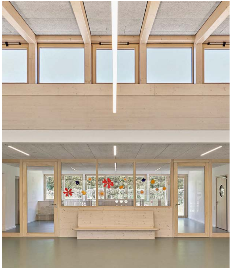
Das tageslichtdurchflutete Foyer mit Blick in den Speisesaal • The foyer with a view into the dining room

Die besonderen Ausbaudetails und einprägsamen Formen machen das Haus für Groß und Klein unverwechselbar und identitätsstiftend. • The distinctive finishing details and memorable forms make the building unmistakable.